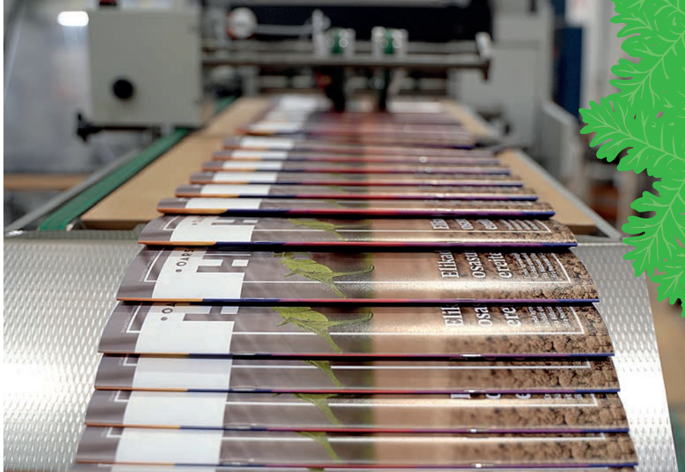
Oñatiko Gertu inprimategian egiten da HITZAren astekaria. I. Saiz

Sare sozial horietan guztietan 30.000 jarraitzaile ditugu. Gainera, Telegram eta WhatsApp kanalak ere baditugu, eta horietan egunero-egunero zabaltzen dira eguneko eduki interesgarrienak, baita posta elektronikoz (astero) ere. ■