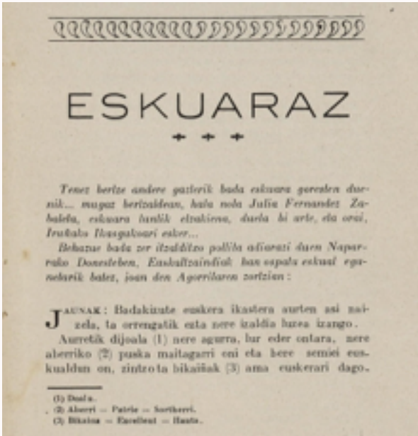
“Gure Herria” 1923

Au izan da feminismoaren garaipen aundiena, baina beste batzuek ere loftu ditu. Efi askotan, emakumeak gizonak ainbat esku-bide ditu; ogibide guziak irikita dauzka, ta gizonarekin batean jau'itzen ditu eriak. Emakumeak izan dituzte batzaf aundi batzuek, asmakari aundiyak jafdakitzeko: esate baterako, ludiko gentzaren alde La Haya'n bildu zana. Toki goratuetan dauden emakumeak ere badira. Orainbe, Rusia sobietikak Noruega'ra bidaldu duan geznarria, emakumea, ta ez gizona, izan da. Egiz, eunki oni emaskumien eunkia deitu dezayokega. Etta emakumien bizieraren aldaketa ikusiaz, ¿zer egin beaf du emakume euskaldunak? ¿Bere alitzifeko oitarakin jafaitu edo aufferapideko bidean saftu?