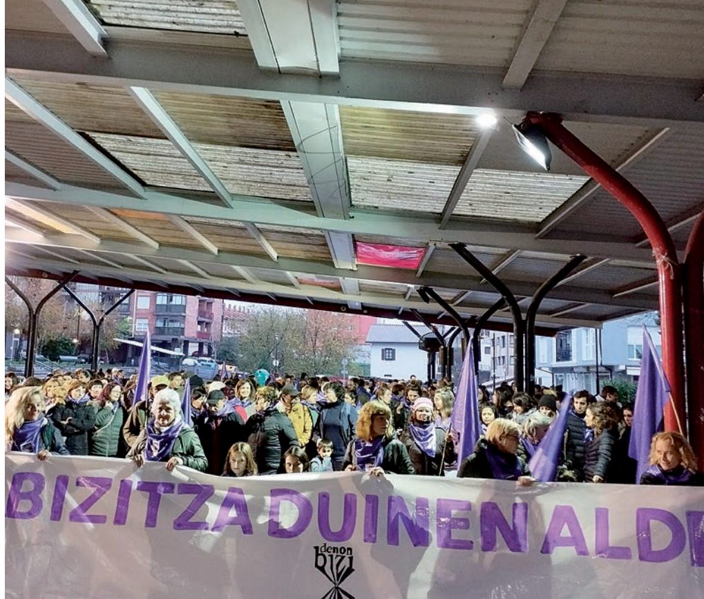
2023ko azaroaren 30eko Greba Feminista Orokorrekoa da ondoko irudia.

Emakumeen ahalduntzerako eta aske bizitzeko espazioak egunero irabazi behar dira. Horiek norbanakoen eguneroko borrokalditik etor daitezke. Baina taldean askoz errazago eta eraginkorrago funtzionatzen da. Horren jakitun, Lezoko Martxoaren 8ko antolatze garaian bat egin dute herriko hainbat eragilek: udalaren babesarekin, Lezoko Iruntzen Emakume Taldea, Gaxuxa Elkartea, Arkirun Pilota Kluba, Emakume Korrikalarien Taldea eta nordic walking-ekoak, Emaion harri tiraketa taldekoak, eta Korrika Batzordea aritu dira Emakumeen