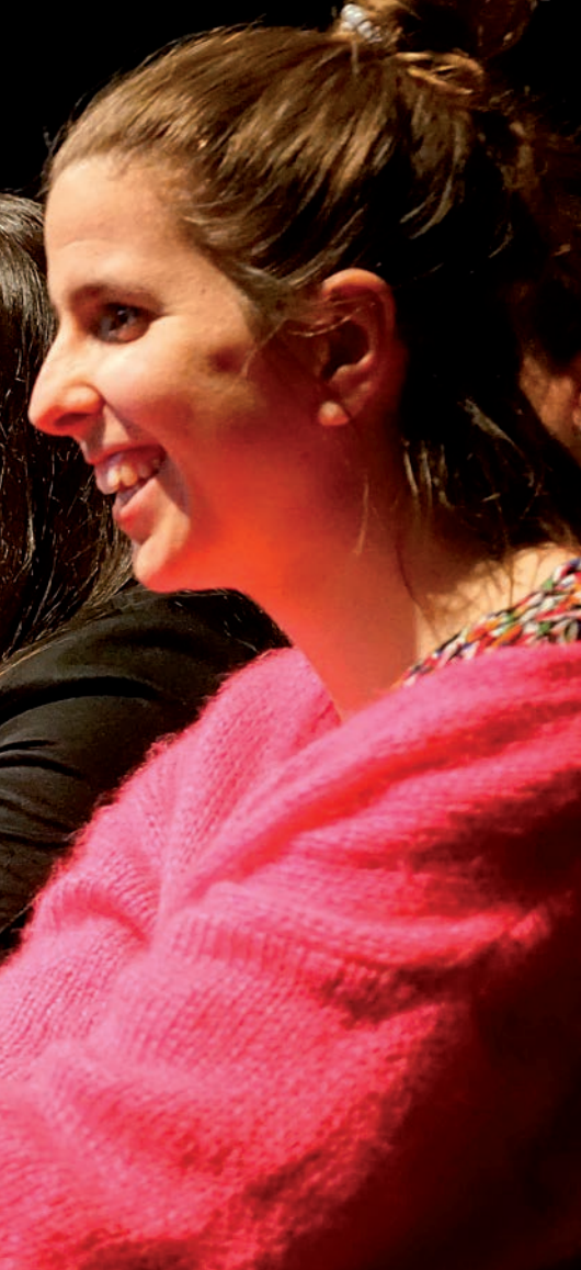
Joan den otsailaren 25ean dozenaka emakumek eskolaren urteurrena ospatu zuten Juanba Berasategi aretoan. Olaia Gerendiain

ra, eskolaren bilakaeraz eta egindako lanak emandakoaz aritzeko. Pozik eta harro dira.