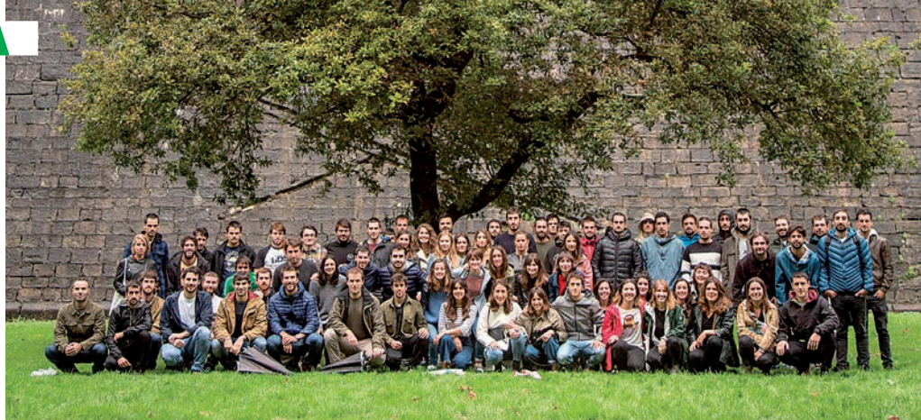
Gaurko 18:30ean berrituko dute Gernikako Arbolako argazkia. HITZA

Hiru urte bete dira Gernikako Arbolan Alardeko gazte talde handi batek gaztaren gaineko iritzia berri bat publiko egin zuela: Alarde Fundazioak ez dituela ordezkatzen, eta emakumeen parte hartzea bermatuta egon behar dela esan zuten. Argazkia atera zutenean uste izan zuten horrekin nahikoa izango zela konponbidea lortu bidean elkarriketak hasteko, hau da, taldea sortzea ez zen izan haien asmoa. Alarde Fundazioari (AF) adierazi nahi izan